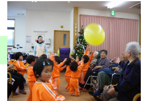
『保育園児との交流』