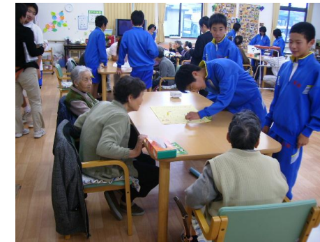
『春日中学生との交流』